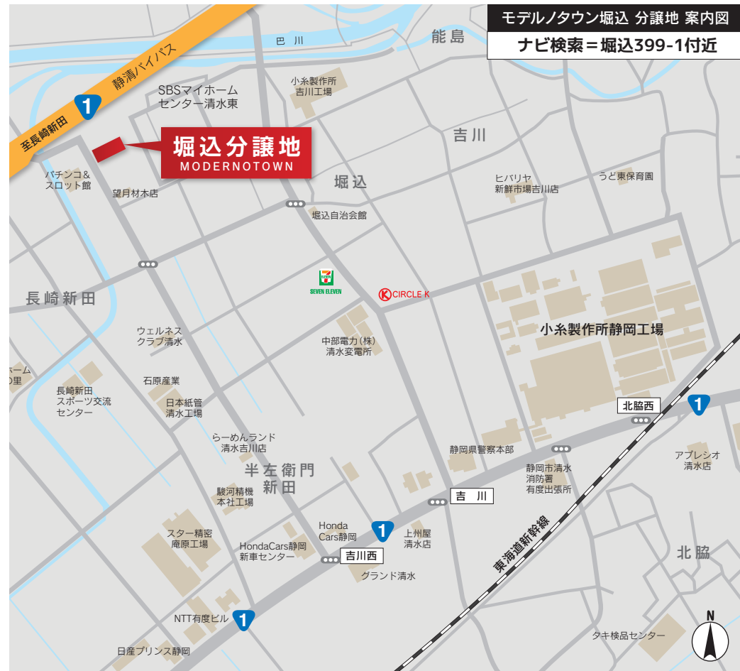
モデルノタウン堀込 分譲地 案内図 ナビ検索 = 堀込399-1付近