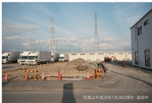
写真は平成24年1月28日現在・造成中